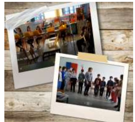
Η συντακτική ομάδα